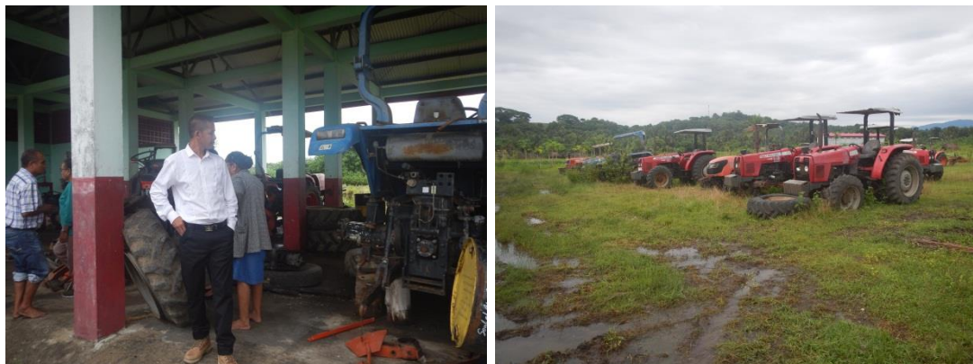
Delegasaun vizita sentru tratores iha Raitahu, suku Uma Wain-Kraik