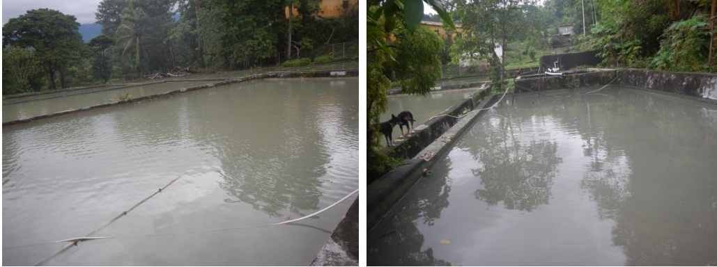
Sentru Viveiros ikan iha Loehunu