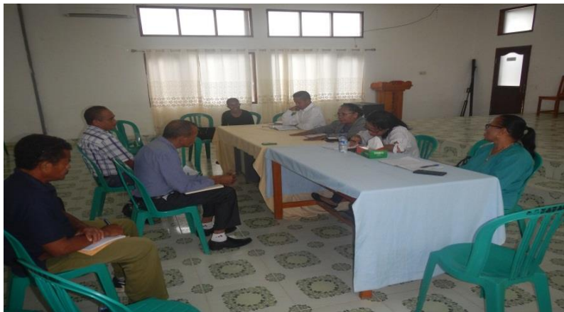
Delegasaun realiza enkontru ho Prezidente Munisipiu no representantes

linhas ministerius, iha Salaun Munisipiu Viqueque