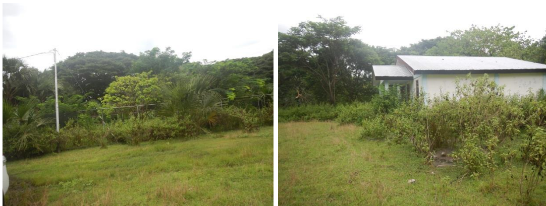
Delegasaun vizita sentru viveiros ai oan iha Raitahu, suku Uma Wain-Kraik

Delegasaun ba vizita sentru viveiros ai oan ne'ebe lokaliza iha Raitahu, suku Uma Wain-Kraik, posto administrativo Viqueque Villa. Iha vizita ne'e, delegasaun observa katak fatin viveiros ai oan abandonado inklui uma ne'ebe utiliza husi tekniku sira. Tuir informasaun ne'ebe hato'o husi representante MAP Munisipiu Viqueque katak fatin ne'e abandonadu kuaze tinan rua ona tanba la iha pessoal seguransa ruma ne'ebe mak atu tau matan no mos la iha moru/lutu ne'ebe halo hodi proteje fatin ne'e husi animal populusaun nian. Kona ba asuntu rua ne'e diresaun MAP munisipiu hato'o ona proposta ba nasional, maibe sidauk aprova.