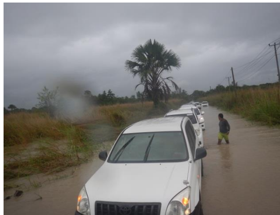
Vizita natar sira ne'ebe abandonadu iha Dilor