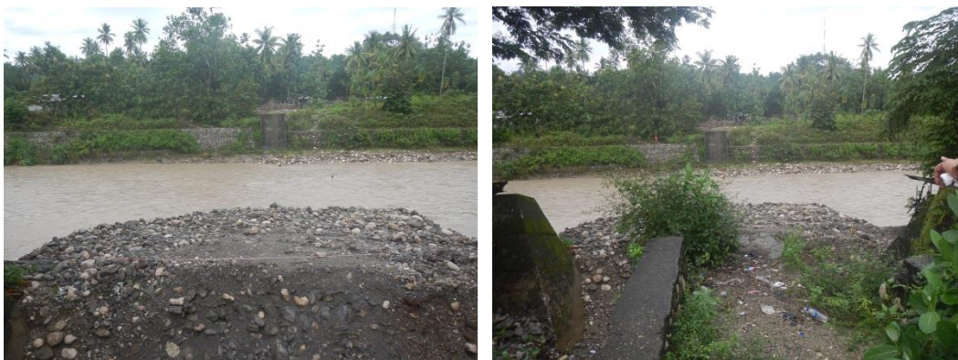
Delegasaun vizita ponte ki'ik ne'ebe sobu sai tiha, iha mota Beloi

Delegasaun ba vizita ponte ki'ik ida iha mota Beloi ne'ebe mak konstrui iha tempu okupasaun Indonesia nian no iha tempu ukun an sei utiliza husi komunidadade sira, liu-liu estudante sira ne'ebe eskola liu husi ponte ne'e ba eskola besik liu. Maibe foin dadauk ne'e iha kompanhia ida mak sobu sai tiha tanba hare ba ponte ne'e nia kondisaun ladiak no tuan ona, maibe atu konstrui foun mak to'ogora sidauk, ho nune'e dificulta estudante sira ne'ebe atu ba eskola tenki hakur mota no wainhira mota bot sira tenki lao ain ho distansia ne'ebe dok hodi ba eskola.