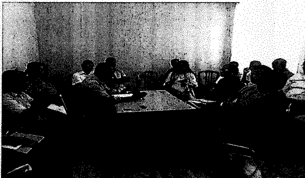
Foto 1. Delegasaun komisaun G hala'o enkontru ho Sekretariu Rejional RAEOA ba asuntu edukasaun no Soliedaridade Sosial, Diretur edukasaun no chefes Departamentu sira.