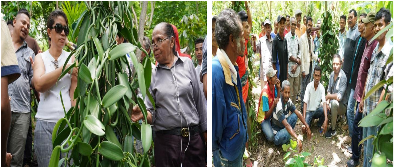
Delegasaun vizita fatin plantasaun baunilha

Rezultadu kolheta baunilha no fan ba iha merkadu, liu husi empresa NCBA/CCT desde 2008. Rezultadu produsaun kada tinan aumenta no iha tinan 2019 mak produsaun tun tanba impaktu husi bailoron ne´ebe naruk.