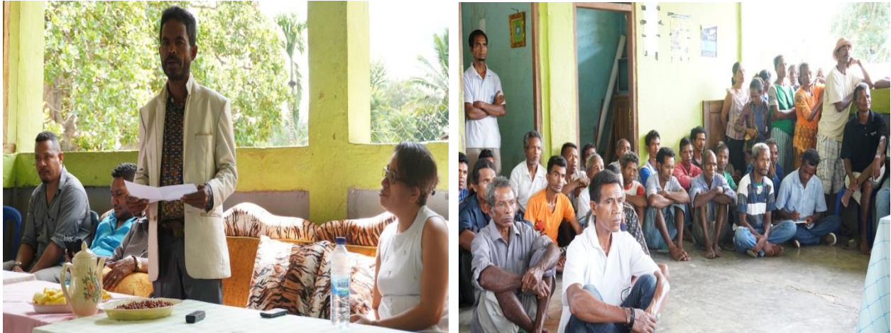
Enkontru ho autoridade lokal no komunidade sira iha sede suku Leimea Sorin Balu